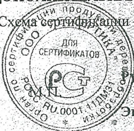
Схема сертификации — Зс по ГОСТ Р 53603-2009.